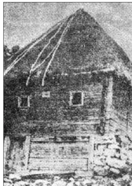
Културни међаш: прва школска зграда у Штиткову